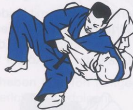
Kuzure-Yoko-Shiho-Gatame (seitliche Festhalte)