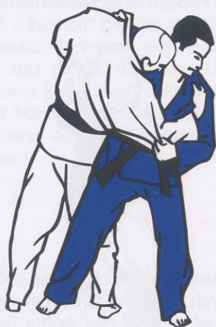
O-Uchi-Gari (Große Innensichel)