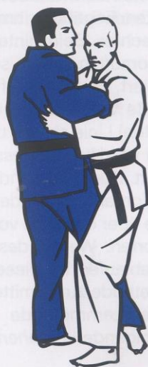
O-Uchi-Gari (Große Innensichel)